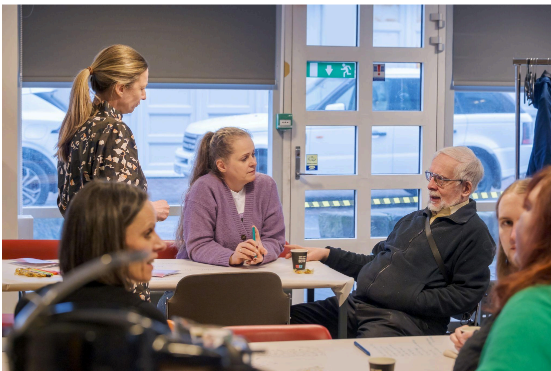
Opnið samtalsrými á vinnustofu Framtíðarfestivalsins þar sem ólíkar kynslóðir mættust og ræddu saman.