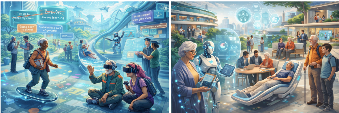
Myndræn túlkun gervigreindar á setningum sem þátttakendur skrásettu í fyrri vinnustofu.

Í þessum hluta urðu jafnframt sýnilegar sterkar hugmyndir gegn við þessa hólfun: að það sem fólk á sameiginlegt fer ekki eftir aldri, að við getum tengst þvert á kynslóðir og að kennitala segir ekki hver manneskjan er eða hvað henni líkar. Þannig varð til sameiginleg kortlagning á því hvar fólk mætir aldursfordómum og hvernig þeir móta daglegt líf og sjálfsmyndir.